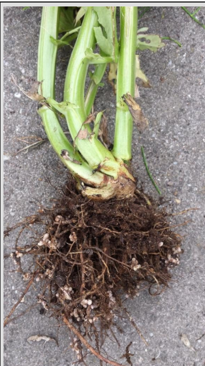
Tuinboonwortels met stikstofbolletjes