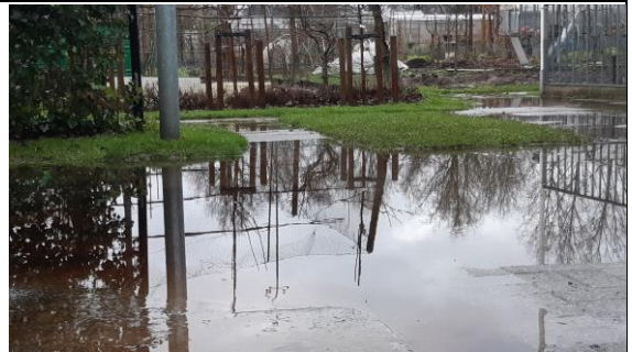
Aanschot aan zee

En dan 2024. Het bestuur wenst alle tuinders een vruchtbare tuinjaar toe met goede opbrengst en tuinplezier.